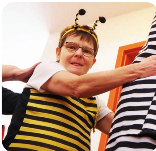
Als Biene summte Frau Brumm durch den Raum.