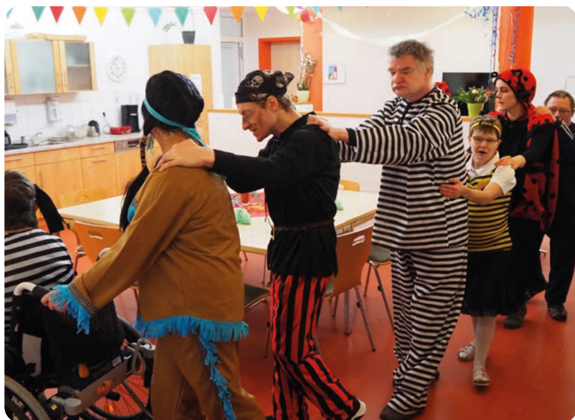
„Hier fliegen gleich die Löcher aus dem Käse ...“ Eine Polonäse gehört zu einem Faschingsfest einfach dazu.