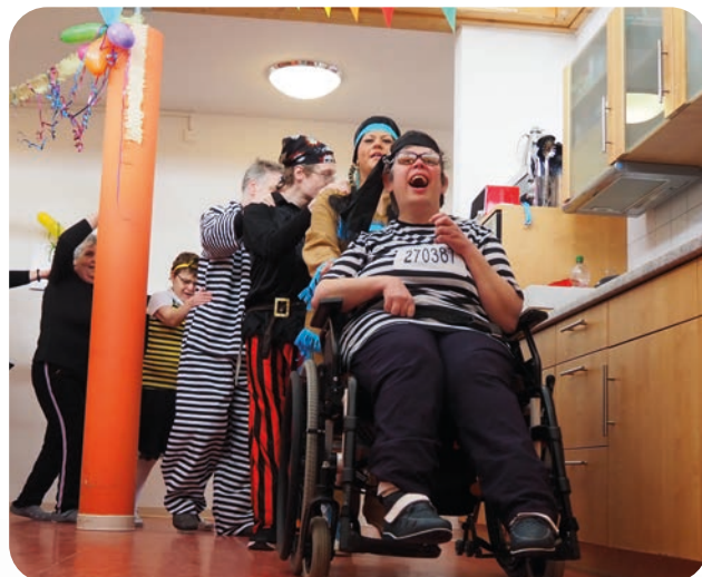
Die Bewohner*innen hatten viel Spaß beim Feiern.