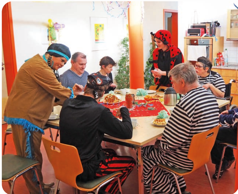
Zum Kaffee gab es frisch gebackene Waffeln.