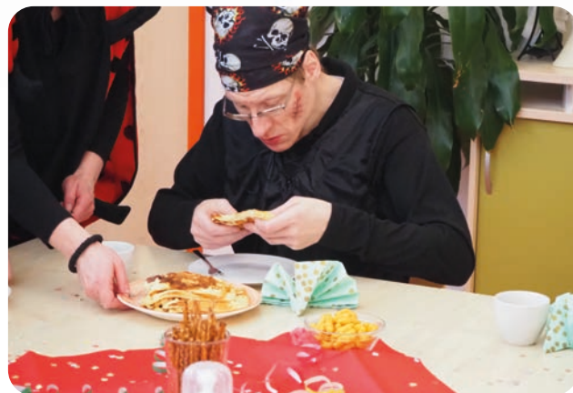
Eine Stärkung für den hungrigen Piraten.